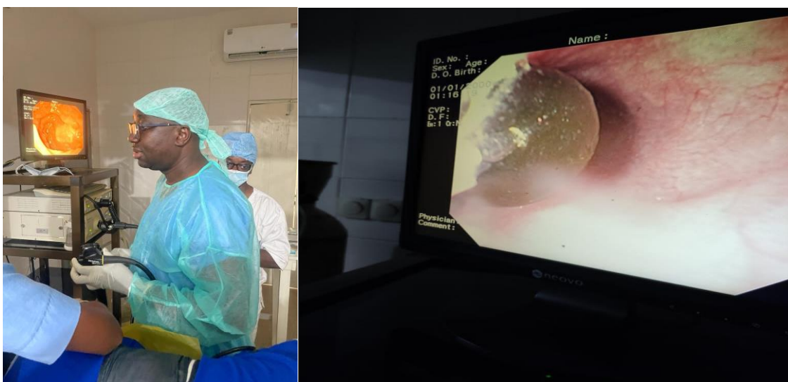
Photo 3 : Endoscopie interventionnelle (Extraction de corps étranger)

Au bloc endoscopique , en dehors des coloscopies totales réalisées dans le cadre du dépistage du cancer colorectal, des endoscopies interventionnelles ont été réalisées durant cette phase. En effet, un enfant de 16 ans, référé pour achalasie de l'œsophage et dont les parents n'avaient pas les moyens a subi gratuitement (sur financement de ONG Bénin-Santé) deux séances de dilatation de l'œsophage . Par ailleurs, une fillette de 6 ans ayant avalé une pièce métallique a subi une intervention endoscopique (extraction de corps étranger) dans la même période (voir photo 3)