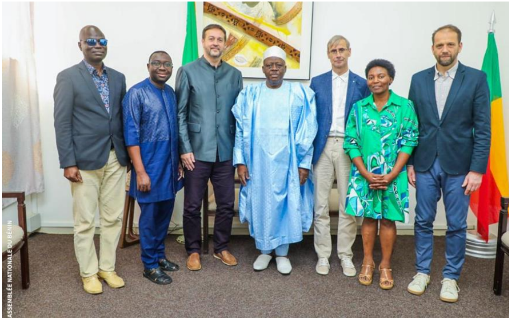
Photo 6 : Rencontre avec le Président de l'Assemblée Nationale du Bénin